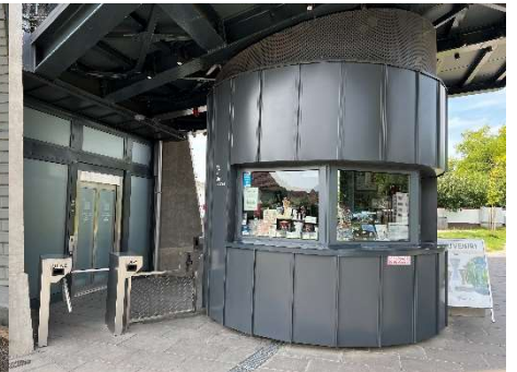
Donau in Palanka (von der Brücke) – Ilok – Vukovar (Kassenhäuschen und Shop am Wasserturm)